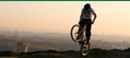
Unterwegs mit der LebensArt