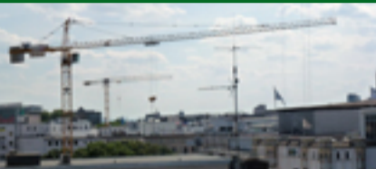
Die Baustellen aus den WDR-Arkaden